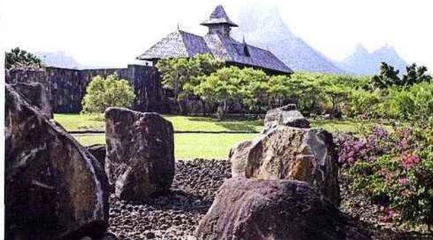
Les bureaux du groupe Medine, entre mer et montagnes.

Notons que, à l'instar du musée “L'Aventure du sucre”, le parc Casela est également fréquenté par une clientèle mauricienne qui découvre là une facette inconnue du pays. Pour l'hôtel Tamarina de 50 chambres au standard 4 étoiles construit à proximité du Golf et du Parc ce sont 350 MRps